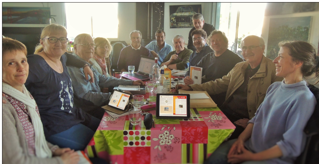
Le journal "Le Lavoir" en est déjà à son 5e numéro et sera prochainement distribué dans les boîtes aux lettres audengeoises.